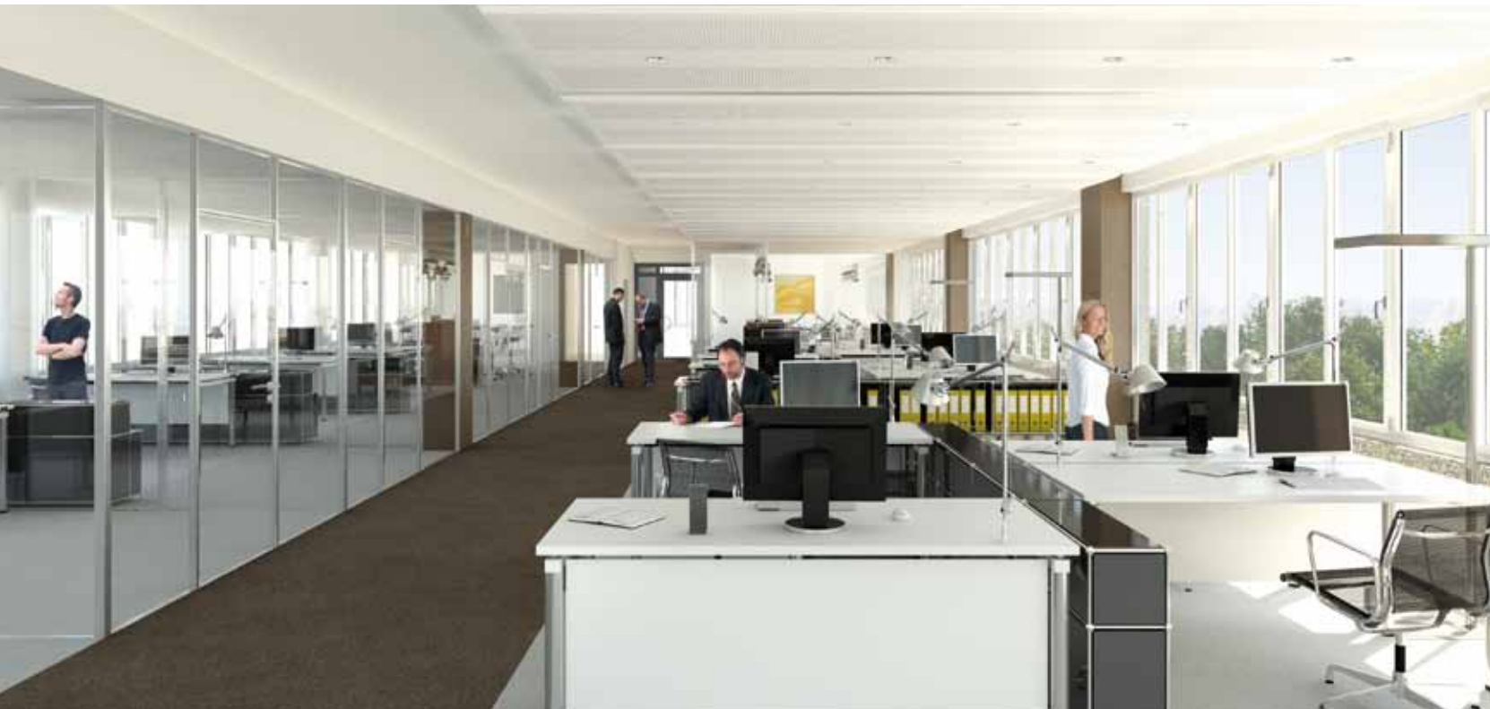
2. Obergeschoss, Bauteil B, ca. 385 m 2