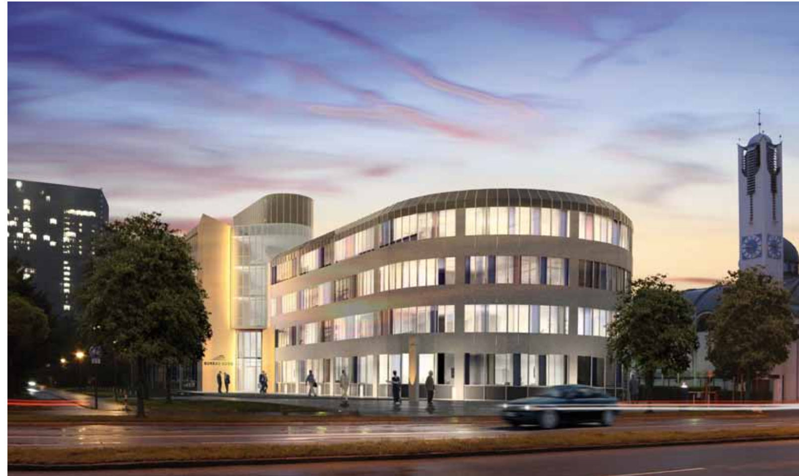
| BUREAU NORD – Ungererstraße 129 |

Schwabing, das als Bohemenviertel der Prinzregentenzeit zu literarischer Berühmtheit gelangt ist, zählt auch heute noch zu den Szenevierteln der bayerischen Landeshauptstadt. Viele renommierte Unternehmen wie MAN oder die Sparkasse residieren in nächster Nähe des BUREAU NORD.